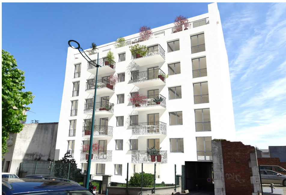
Rénovation-réhabilitation d'un collectif pour Gennevilliers Habitat - Vue photoréaliste

La modélisation 3D de l'enveloppe thermique et du réseau aéraulique permet à ce cabinet d'architectes de systématiquement proposer une alternative dite « passive » au projet initialement commandé par le maître d'ouvrage.